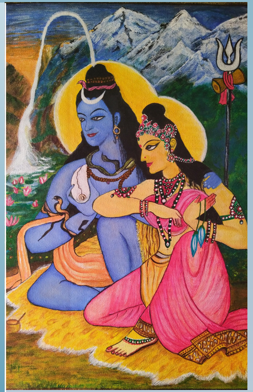
Shiv Parvati Painted By Parul Bradu